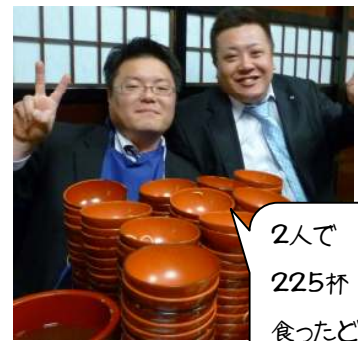
2人で 225杯 食べたぞ〜!

色々問題はありますが、我が街 さいたま市で 「私は瓦礫処理の 受入れ賛成派です」と表明していきます!